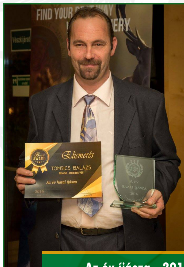
Az év íjásza - 2016

Először a sárvári íjász egyesület tagja volt, majd 2015-ban csatlakozott a Haladás VSE családjához, hogy meg tudja valósítani céljait. Hamar jöttek az eredmények, mivel a tehetség mellé szorgalom is párosult. Alázata a sportíjászat felé példaértékű. A komolyabb eredmények szintén 2015-re datálhatók. Íjászberkekben is gyorsan ismerté vált és szinte minden versenyen sikerül dobogóra állnia. Több OB és nemzetközi érmet is sikerült rövid pályafutása alatt begyűjteni, pedig az egyik legerősebb kategóriában versenyez. 2016-ban pedig a Haladás VSE év íjásza címet is elnyerte.